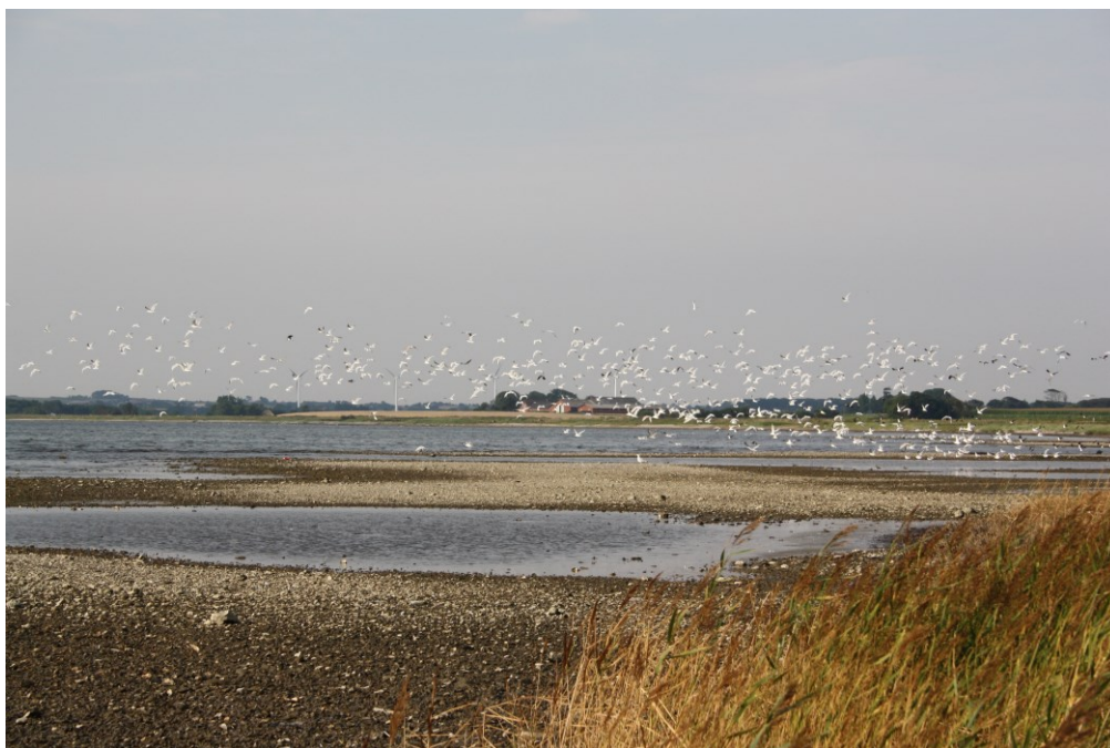
Dråby Vig syd for molen