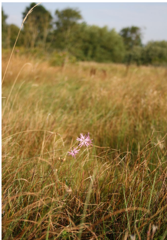
Trævlekrone, Dråby Vig

Den kommunale Natura 2000-handleplan er som udgangspunkt omfattet af krav om miljøvurdering i henhold til lov om miljøvurdering af planer og programmer og af konkrete projekter (lovbekendtgørelse nr. 425 af 18. maj 2016). For samtlige statslige Natura 2000-planer er der foretaget en strategisk miljøvurdering. Handleplanerne har et indhold, der ikke adskiller sig fra de oplysninger, som allerede er givet i de miljøvurderede Natura 2000-planer. Da handleplanen ikke sætter nye rammer for fremtidige anlægstilladelser eller yderligere vil kunne påvirke internationalt udpegede naturbeskyttelsesområder væsentligt, er det kommunens vurdering, at der ikke er behov for en fornyet miljøvurdering.