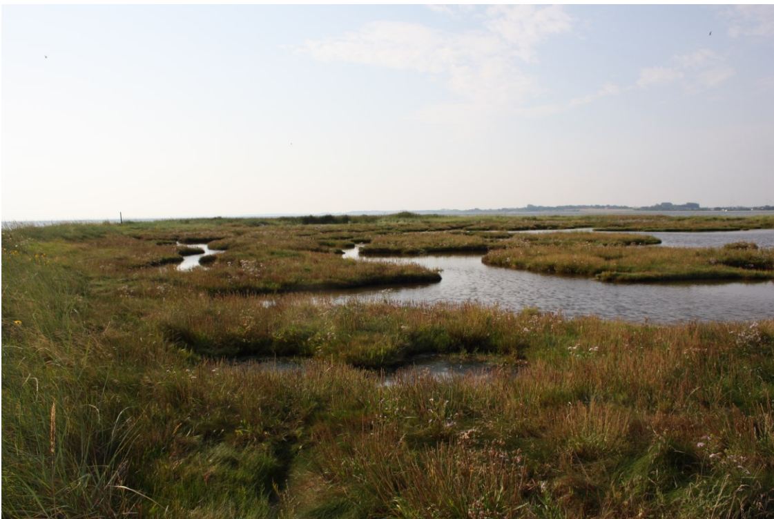
Dråby Vig syd for molen

Arealet med surt overdrev er gået tilbage i løbet af 1. planperiode. Ifølge basisanalysen skyldes denne tilbagegang at der er sket en ændring af registreringen af naturtypen strandeng, således at mosaikforekomster medregnes i denne naturtype. Det betyder, at nogle områder der tidligere var kortlagt som surt overdrev nu er registreret som strandeng. Der er således ikke tale om en egentlig tilbagegang af naturtypen. Strandvold med flerårige planter og grå/grøn klit er nye naturtyper i Natura 2000 området, der ikke var med i den gamle kortlægning. Naturtypen grå/grøn klit ligger på Naturstyrelsens areal.