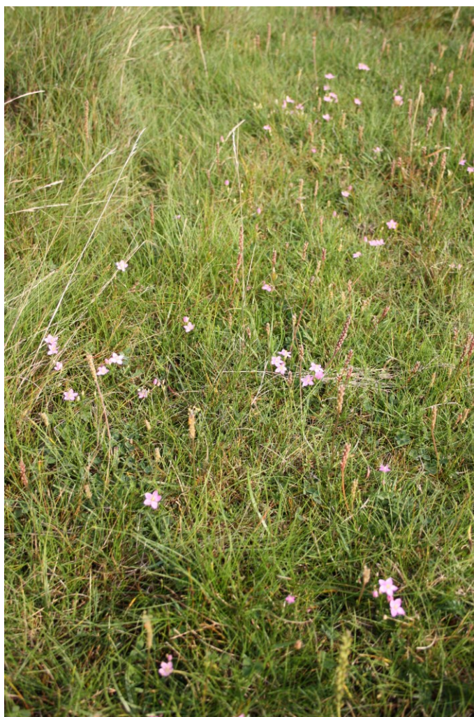
Liden tusindgylden, Buksør Odde

Alle tiltag vil blive udført i tæt dialog og samarbejde med de berørte lodsejere ved frivillige aftaler. Indsatsen forventes at være fordelt over hele Natura 2000 områdets geografiske udstrækning. Herudover vil kommunen sikre, at der så vidt mulig planlægges for at opnå synergi mellem Natura 2000- og Vandplanindsatsen.