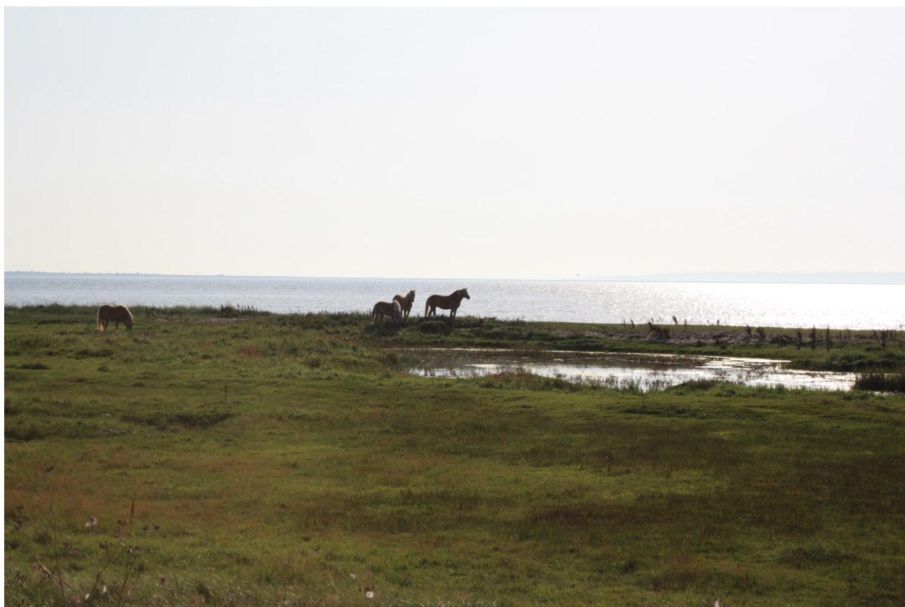
Heste på strandeng, Dråby Vig.

Projekterne gennemføres ved frivillige aftaler, og derfor er det i mange tilfælde ikke på nuværende tidspunkt muligt at beskrive hvornår eller hvorvidt projekterne fysisk bliver udført. Kommunen vil i hvert enkelt tilfælde sørge for, at relevante interessenter bliver inddraget.