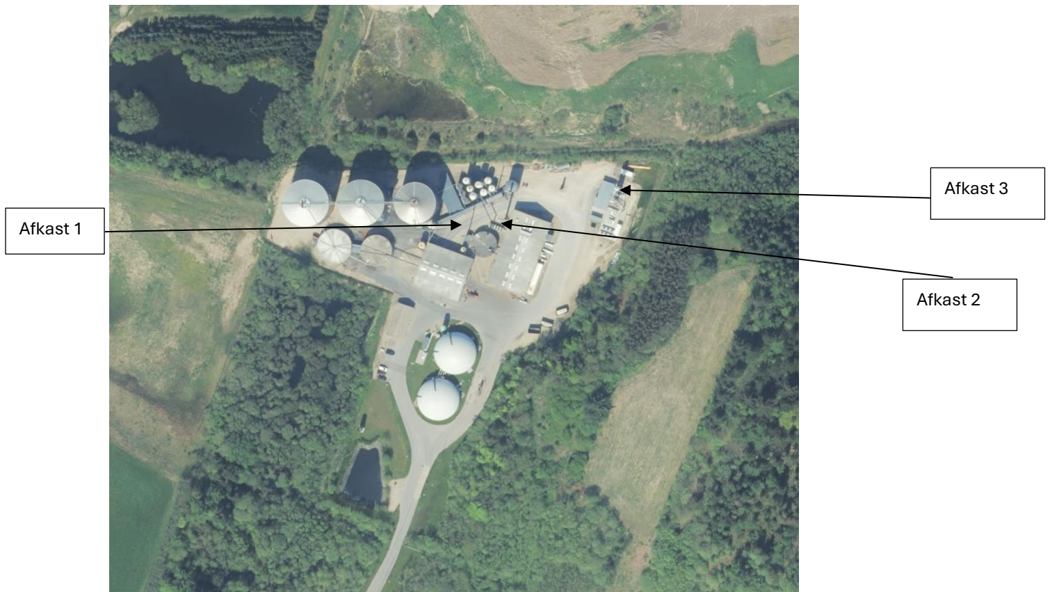
Figur 1-1: Skærmbild med nummerering af biogasanlæggets punktkilder til atmosfæriske emissioner. Afkast 1-3 markerer de eksisterende afkast. 1 = biofilter, 2 = naturgaskedel, 3 = gasopgraderingsanlæg.

Figur 1-1 viser placering og nummerering af anlæggets emissionskilder.