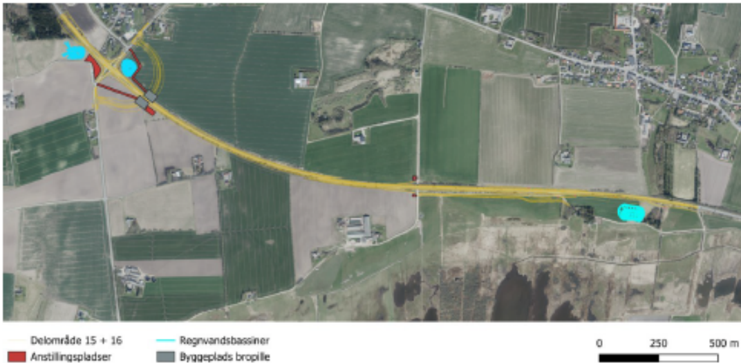
Figur 2 Oversigt over regnvandsbassiner (vist med turkis) og anstillingspladser (vist med rødt) ved delprojekterne 15 + 16. Længst mod vest ligger bassin B2, i rampekvadranten ligger bassin K2 og længst mod øst ligger bassin B3.

Arealet udgør i dag åbent markareal samt arealer med græs, der anvendes som rabatter til Vildsundvej.