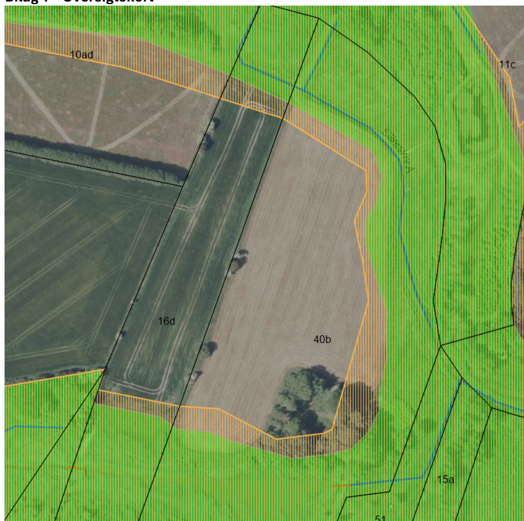
Figur 1 - Den grønne skravering angiver udpegingen "vådområdeprojekter", den orange skravering angiver udpeging af "skovrejsning uønsket" og den blå linje angiver åløbet.