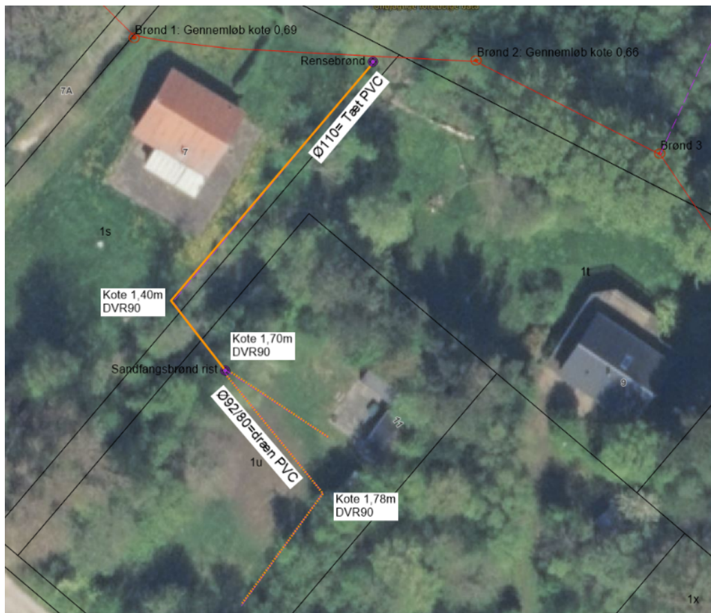
Figur 1. Luftfoto (2024). Projektets beliggenhed og dimensioner. Lilla streg: Dimensioner og placering af dræn på Utkæret 11. Rød stiplet linje: Rørlagt vandløb (F134 / Utkær Fælles rørledning).

Der meddeles hermed tilladelse til medbenyttelse jf. § 5 i Vandløbsloven 1 og tilladelse til etablering af nyt vand jf. § 21 i Vandløbsloven og § 5 i Reguleringsbekendtgørelsen 2 .