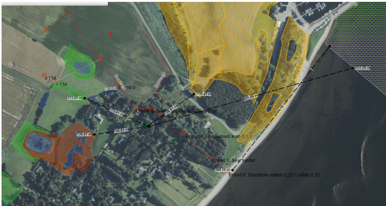
Figur 3. Afstand til beskyttede naturtyper og Natura 2000-områder.

Sænkning af grundvandsstanden vil potentielt kunne påvirke våde naturtyper og dermed ændre deres tilstand. Det er Morsø Kommunes vurdering, at projektet på Utkæret 11 alene har lokal virkning af på grundvandsstanden, og at projektet derfor dels på grund af afstand og dels på grund af bundkote ikke vil påvirke § 3 beskyttet natur.