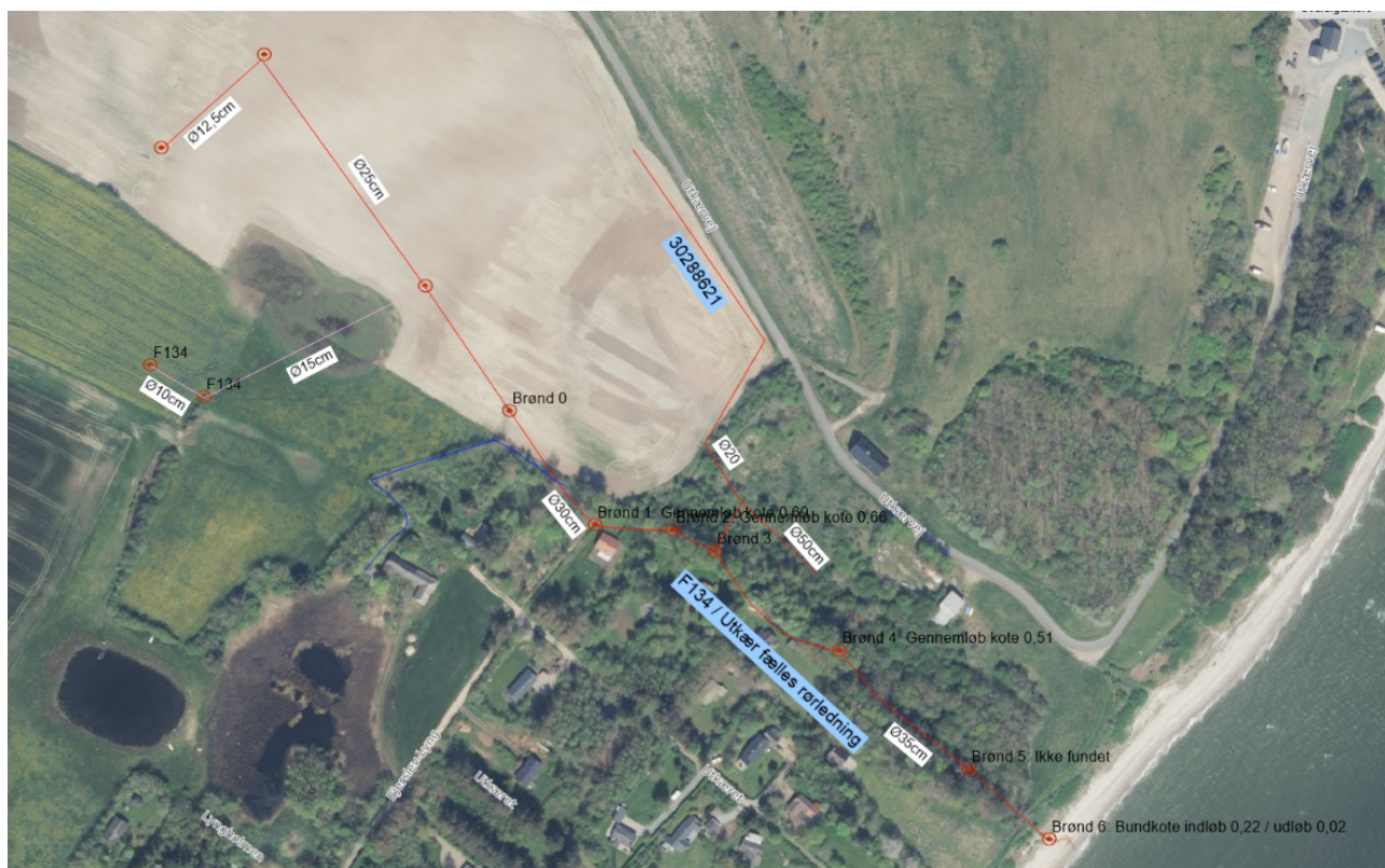
Figur 2. Luftfoto (2024). Oversigtskort over F134 / Utkær fælles rørledning med dimension.

Der etableres rensebrønd tæt op ad F134 / Utkær Fælles rørledning, og anbringelse sker med en in-situ gummipakning. Derved opnås mulighed for at rense både ind i F134 / Utkær Fælles rørledning og op i drænet, se figur 1.