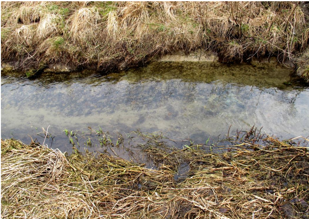
På prøvetagningsstedet nedstrøms Markmølle Dambrug er bundet sandet og med grus og sten. På undersøgelsestidspunktet var der lidt aflejringer af brunt slam og en del bebovninger af brune kiselalger langs bredderne og på vandplanterne som tegn på, at vandløbet var belastet med organisk stof og næringsstoffer. Foto: 11. april 2013.