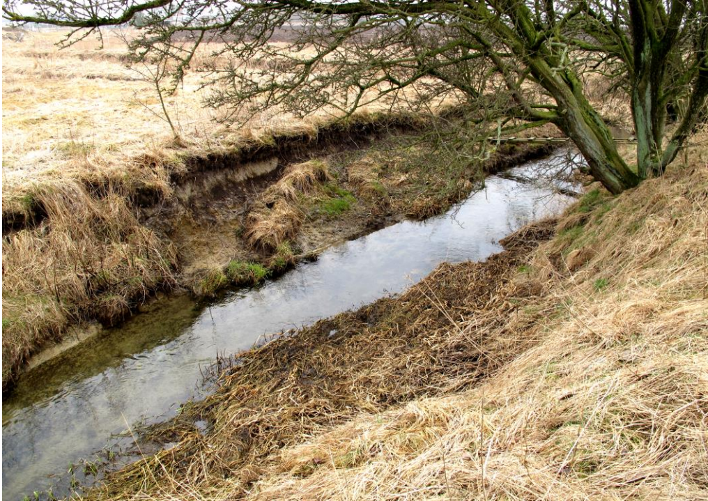
Nedstrøms Markmølle Dambrug er Lødderup Bæk reguleret, og den ligger ret dybt under terrænet. Bækken har forholdsvis ensartede fysiske forhold med et jævnt til godt fald over sandet bund og stedvis med en del grus og sten. Smådyrsprøven er taget på denne strækning, som har UTM-kordinaterne: 0489006/6293323. Foto: 11. april 2013.