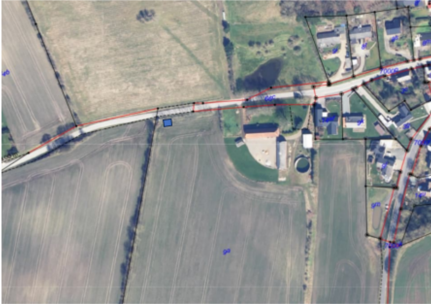
Figur 5 Placering på matrikel markeret med blå firkant.