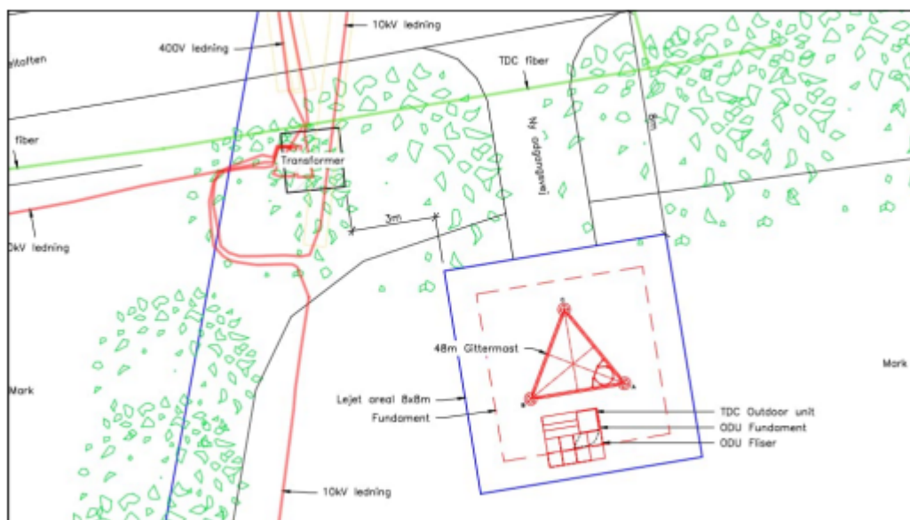
Figur 6 Detaljeret situationsplan