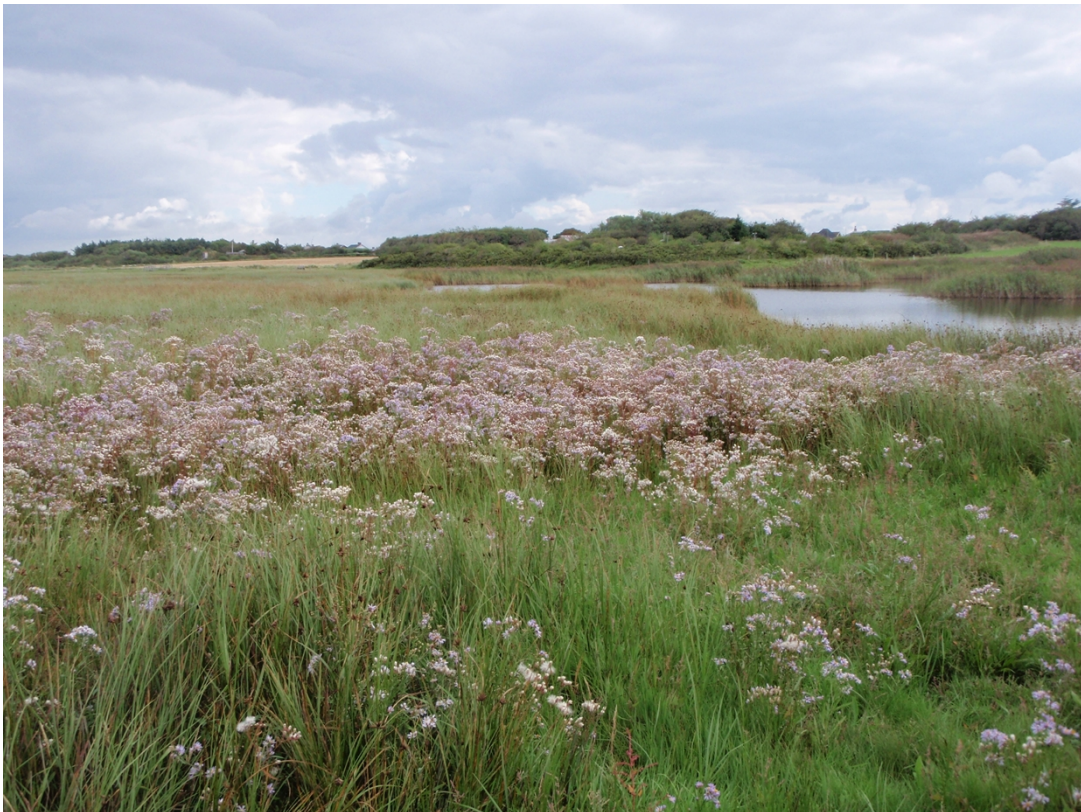
Strandeng ved Karby