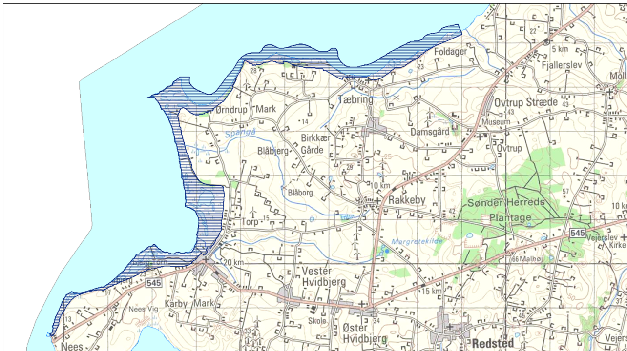
Blå skravering angiver udstrækning af Natura 2000 området

Indsatsen udføres af lodsejere i området og gennemføres i videst muligt omfang gennem frivillige aftaler. Der findes blandt andet en række tilskudsordninger, som kan søges gennem NaturErhvervstyrelsen.