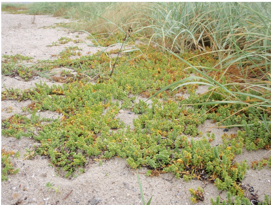
Strandarve ved Karby

Den kommunale Natura 2000-handleplan er som udgangspunkt omfattet af krav om miljøvurdering i henhold til lov om miljøvurdering af planer og programmer og af konkrete projekter (lovbekendtgørelse nr. 1533 af 10. december 2015). For samtlige statslige Natura 2000-planer er der foretaget en strategisk miljøvurdering. Handleplanerne har et indhold, der ikke adskiller sig fra de oplysninger, som allerede er givet i de miljøvurderede Natura 2000-planer. Da handleplanen ikke sætter nye rammer for fremtidige anlægstilladelser eller yderligere vil kunne påvirke internationalt udpegede naturbeskyttelsesområder væsentligt, har kommunen forud for den endelige vedtagelse af handleplanen truffet afgørelse om, at der ikke er behov for en fornyet miljøvurdering.