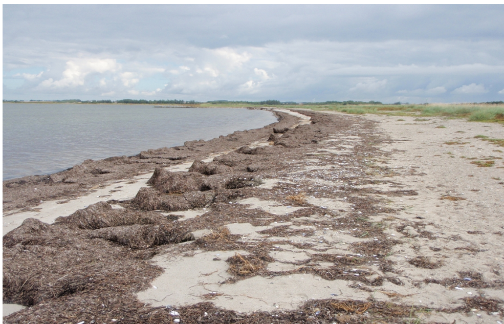
Opskyl af ålegræs ved Karby