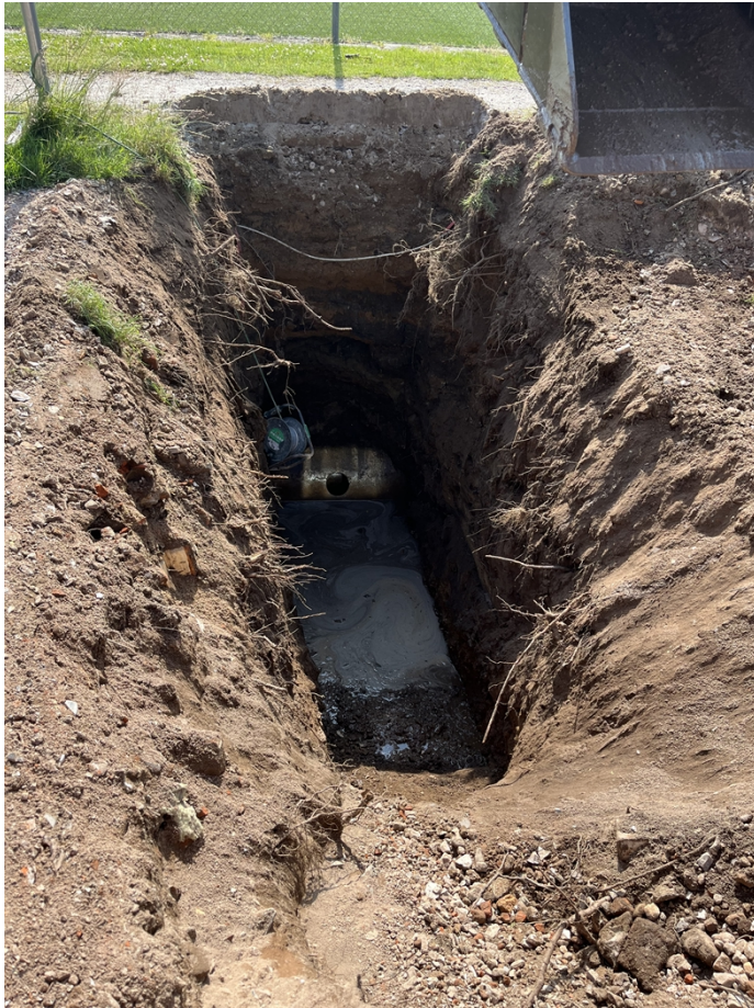
Foto 1. P-pladsafvandingen tilledes Præstegårdsbækken ved direkte tilkobling af Ø110 PP på Ø70cm betonrør.

Matr.nr. 7i Vejerslev Præstegård, Vejerslev har et samlet areal på 2.440m 2 , hvoraf P-pladsen udgør et areal på ca. 1.400 m 2 . P-pladsen er etableret med grusbelægning, og merafstrømning til afvandingssystemet består udelukkende af opsamling af tagvand fra et areal på ca. 100 m 2 .