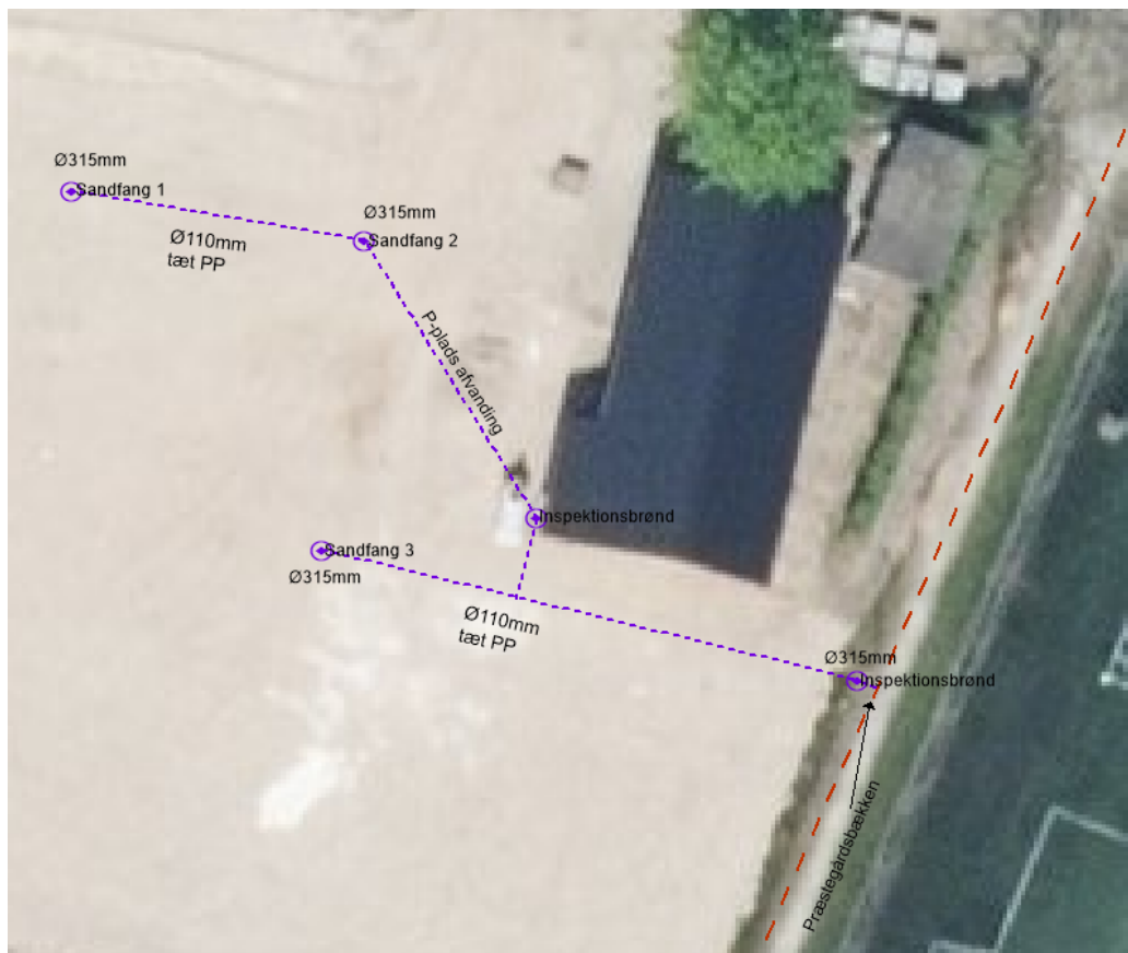
Figur 2. Oversigtskort over projektbeskrivelsen.

Præstegårdsbækken er på strækningen, hvor P-pladsafvandingen tilkobles, bestående af Ø70cm betonledning beliggende med bundkote ca. 20,53 mDVR90, dvs. P-pladsafvandingen har tilløb til Præstegårdsbækken ca. 3,2 m under terræn.