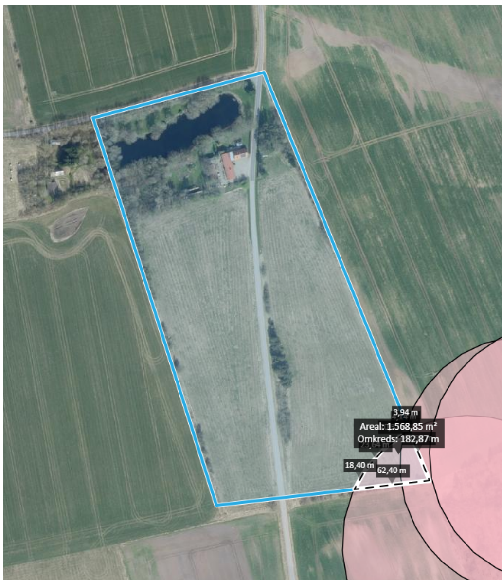
Bilag 1 Den blå markeringer viser afgrænsningen af matr. 13b, de lyserøde markerede cirkler, viser fortidsmindebeskyttelseslinjen, hvor den stiplede linje viser beskyttelseslinjen inden for det ønskede skovrejsningsområde.