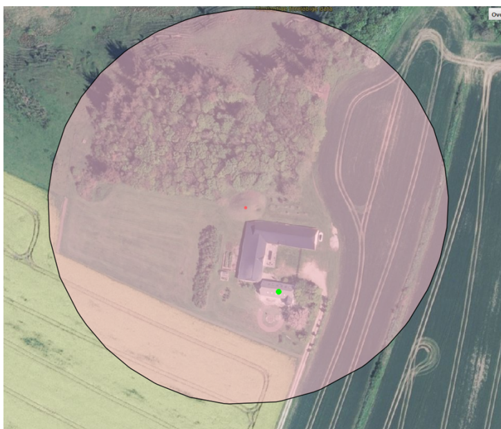
Luftfoto med rundhøjen (rød punktmarkering) og dets beskyttelseszone samt ejendommens bebyggelse.

Afstanden mellem rundhøjen og nærmeste tagvindue er ca. 44 m. Det ansøgte ligger således indenfor fortidsmindebeskyttelseslinjen på 100 m fra rundhøjen.