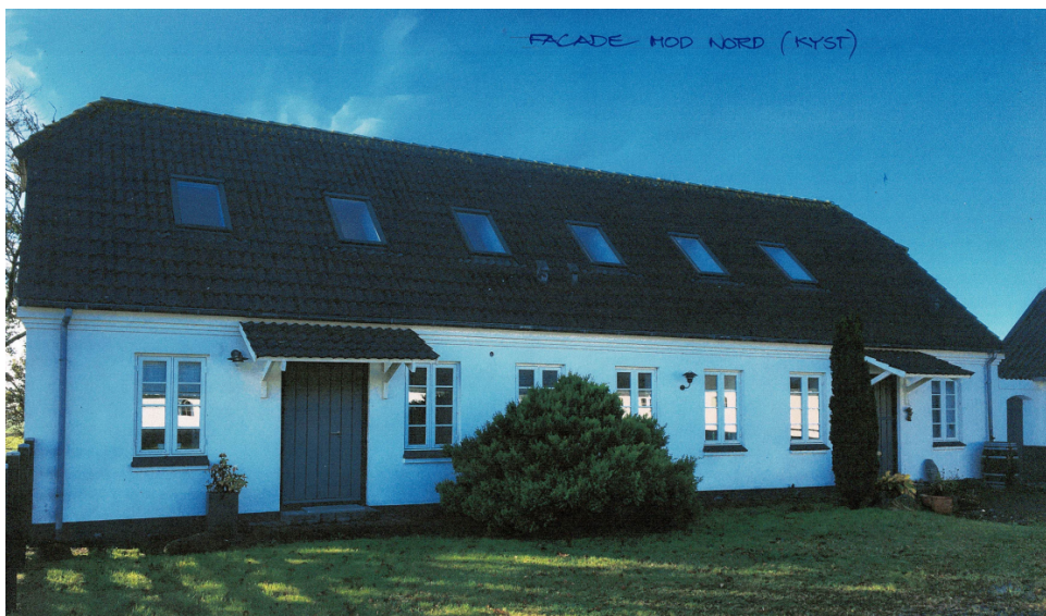
Foto af beboelseshuset og de seks tagvinduer.

Afstanden mellem rundhøjen og nærmeste tagvindue er ca. 44 m. Det ansøgte ligger således indenfor fortidsmindebeskyttelseslinjen på 100 m fra rundhøjen.