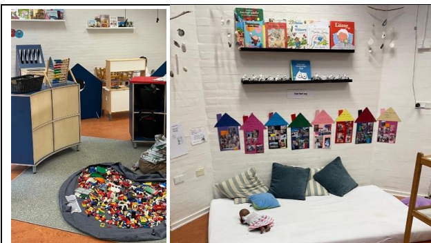
Afgrænset læringsrum der inviterer til lege og fordybelse