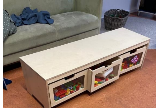
Legemateriale tilgængelig for børnene og i børnehøjde