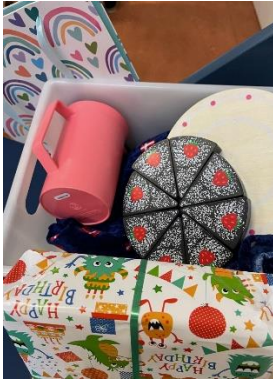
Kasse til legemanuskript: fødselsdag