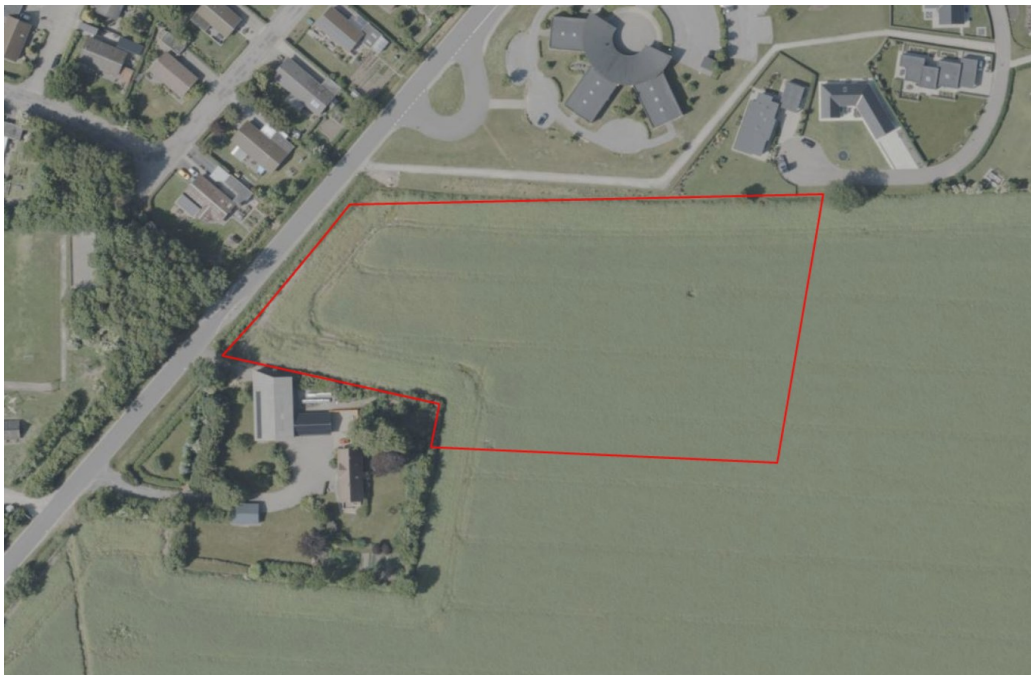
Figur 1: Oversigt over lokalplanområdet ved Udvejen og syd for Lægehuset ved Doktor Lunds Vej i Øster Jølby

Jernbanevej 7 7900 Nykøbing Mors Telefon 9970 7000 kommunen@morsoe.dk morsoe.dk